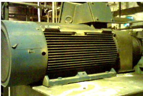
散热不良导致电机外壳温度异常